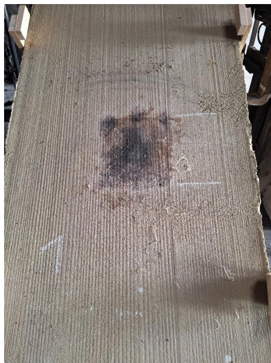
Próbka 1 po badaniu (nachylenie 45°)