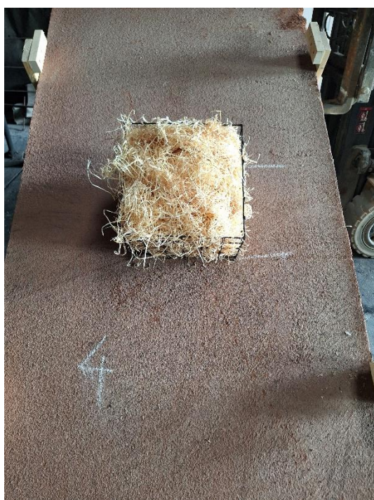
Próbka 4 przed badaniem (nachylenie 45°)