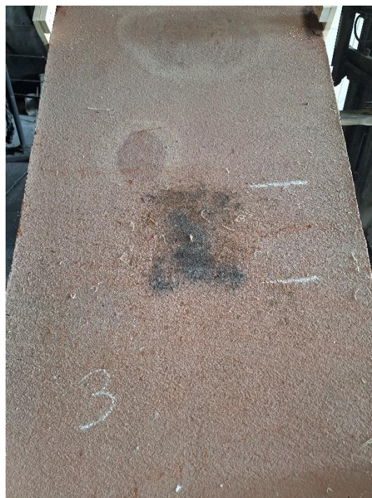
Próbka 3 po badaniu (nachylenie 45°)