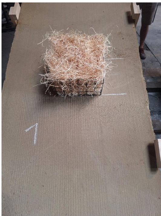
Próbka 1 przed badaniem (nachylenie 15°)