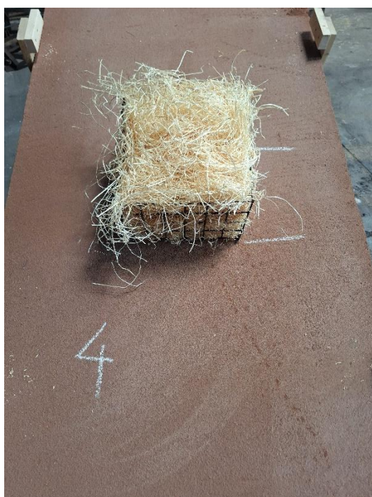
Próbka 4 przed badaniem (nachylenie 15°)