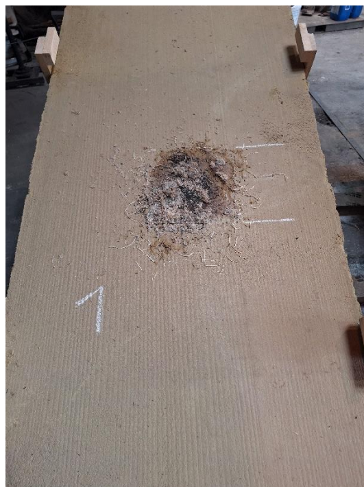
Próbka 1 po badaniu (nachylenie 15°)