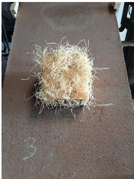
Próbka 3 przed badaniem (nachylenie 45°)