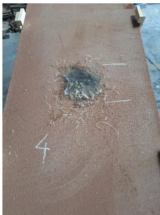
Próbka 4 po badaniu (nachylenie 15°)