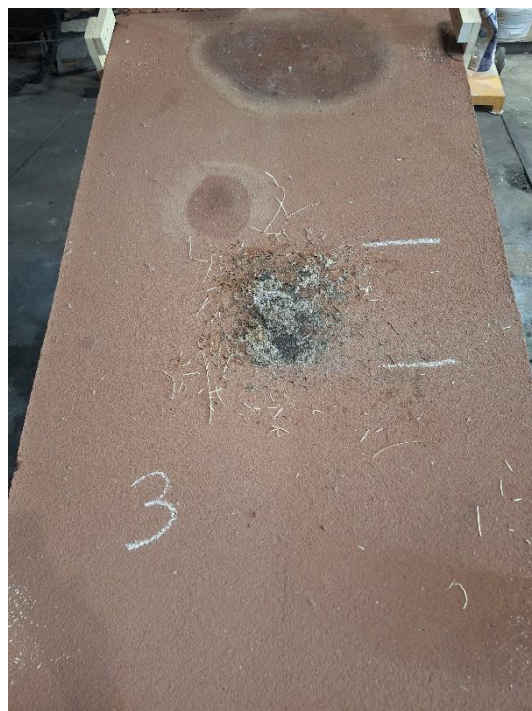
Próbka 3 po badaniu (nachylenie 15°)