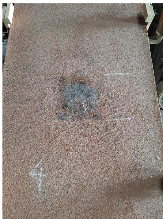
Próbka 4 po badaniu (nachylenie 45°)