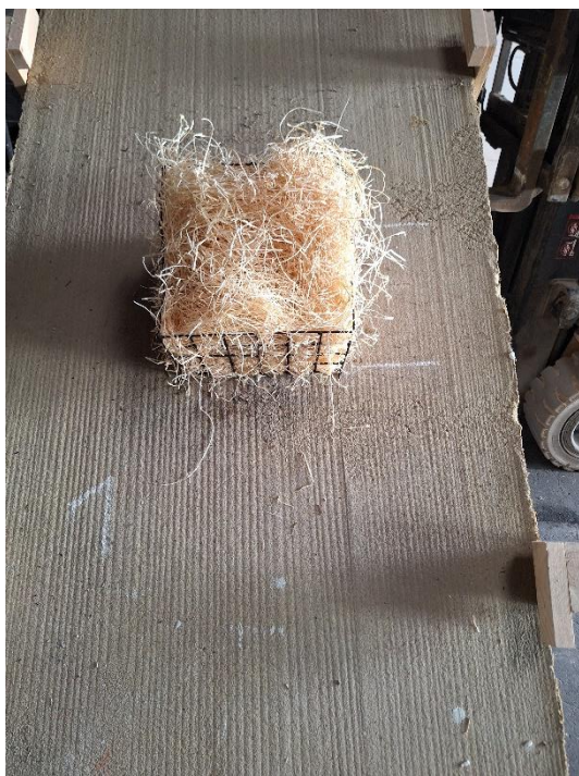
Próbka 1 przed badaniem (nachylenie 45°)